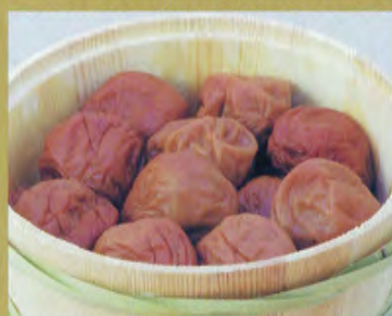
◆ Umeboshi (prunes salées)