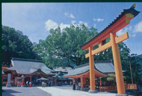
Kumano Nachi Taisha