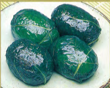
◆ Mehari Zushi (boule de riz)