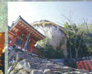
L'énorme rocher "Goto-biki" (nommé d'après le crapaud ponais) du temple Kamikura.