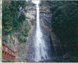
Le sanctuaire Hiro (Hiro-jinja), qui fait partie du Kumano Nachi Taisha, a été édifié pour vénérer la chute d'eau de Nachi, la plus haute cascade du Japon.

La divinité principale du temple est Fusumi-no-okami (Izanami-no-mikoto) et son honjibutsu (équivalent bouddhiste) est Senju Kannon (Kannon aux mille bras).