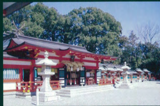
Kumano Hayatama Taisha