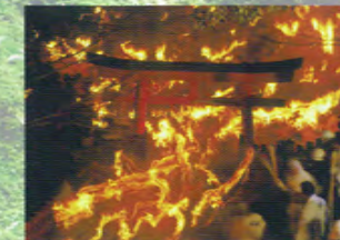
Festival du feu de Shingu (6 février)