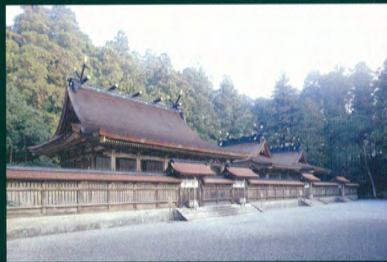
Kumano Hongu Taisha