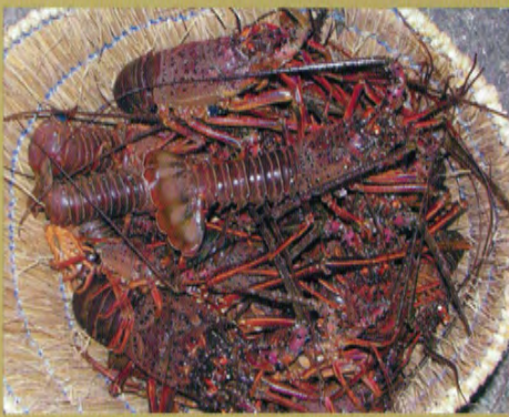
◆ Ise-ebi (langoustes d'Ise)