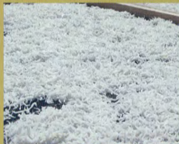
◆ Shirasu (alevin de sardine)