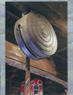
Le gong Oowaniguchi, le plus grand du Japon.

Autrefois, ce temple faisait partie du Kumano Nachi Taisha sous le nom de "Nyoirin-do".