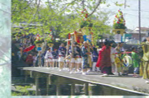
Festival annuel (15 avril)