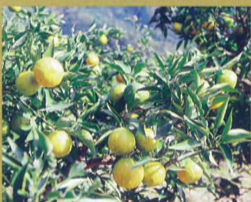
◆ Jabara (variété de clémentines)