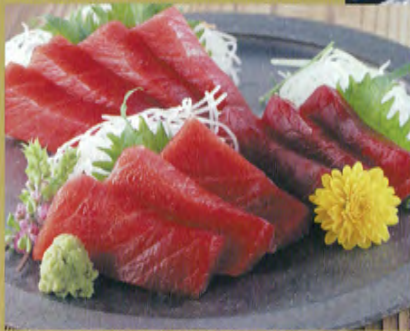
◆ Sashimi de thon

La région est célèbre pour ses marchés au poisson où le thon est vendu frais. Au petit matin, les thons pêchés dans les eaux proches sont alignés au marché où résonnent les voix énergiques des acheteurs.