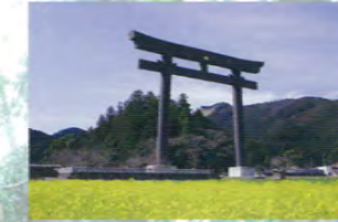
Le grand torii de Oyunohara, à l'ancien emplacement du Kumano Hongu Taisha