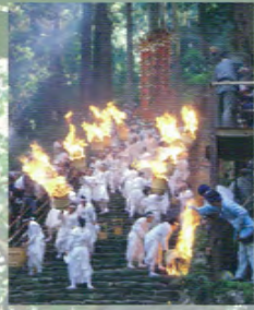
Festival du Feu de Nachi (14 juillet)