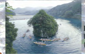
Festival des bateaux Mifune (16 octobre)

Autrefois situé sur un banc de sable de la rivière Kumano nommé Oyunohara, le temple a été reconstruit à son emplacement actuel après les inondations de 1889. La divinité principale du temple est Ketsumiko-no-ookami (Susanoo-no-mikoto), et son honjibutsu (équivalent bouddhiste) est Amida Nyorai.